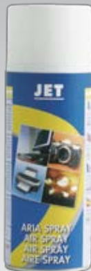
191 400 ml