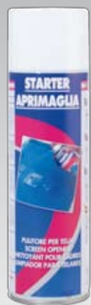
124 500 ml