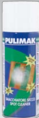
103 400 ml