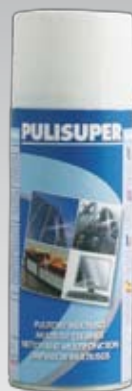
135 400 ml