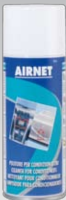
131 400 ml