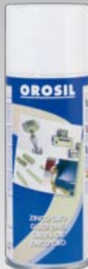
141 400 ml