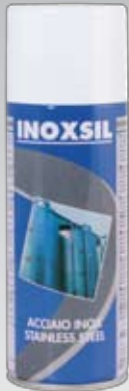
112 400 ml