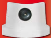
TASTINO LARGO LARGE NOZZLE