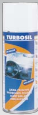
110 400 ml