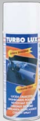
110X 400 ml