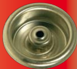
VALVOLA FEMMINA FEMALE VALVE