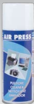
191A 400 ml