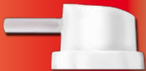
TASTINO INNOVATIVO INNOVATIVE NOZZLE